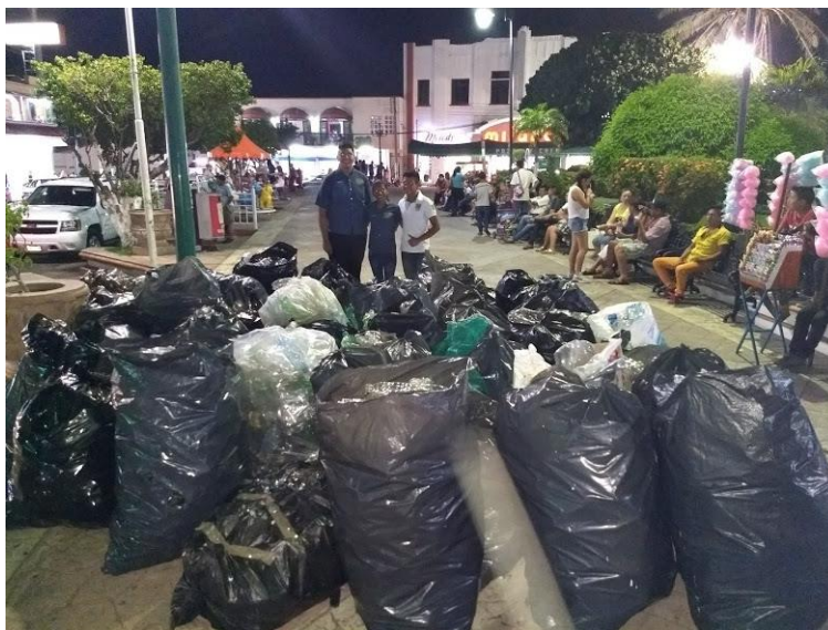
Ilustración 4. Resultado de Recolección del Concurso de Reciclaje

Esta actividad del concurso de reciclaje no sólo permitió que el alumno invitara a alumnos de otras instituciones a participar de manera activa, sino que esto les permitió implementar estrategias para poder administrar sus recursos y sufragar los gastos correspondientes.