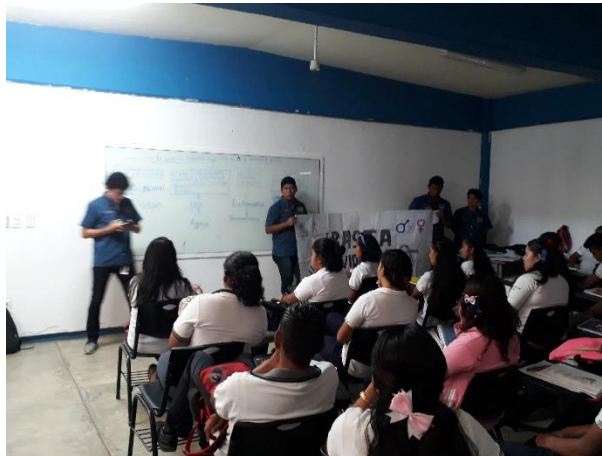
Ilustración 2. Equipo en la Campaña Informativa de Violencia de Género

El equipo de Sustentabilidad que adoptó el nombre “Yarso” (por las iniciales de los nombres de los integrantes) realizó campañas informativas en las escuelas de nivel medio superior sobre la conservación de los recursos naturales, la sustentabilidad, entre otras y cápsulas informativas a lo largo de las emisiones del programa de televisión. El equipo fue organizador de la brigada representante de la UNACH en la marcha por el Día Mundial del Agua, donde realizaron pancartas, gritaban consignas y repartían folletos sobre la conservación del vital líquido.