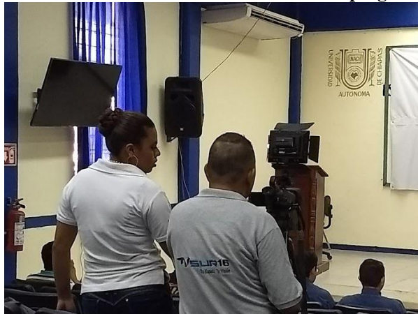
Ilustración 1. Grabación de una emisión del programa

Por su parte el equipo de violencia de género realizó una campaña de información sobre la violencia en el noviazgo dirigida a los alumnos de nivel medio superior, en dicha campaña se realizaron presentaciones y se repartieron folletos informativos. En las emisiones del programa los integrantes de este equipo hacían cápsulas informativas donde se detallaban señales de alerta sobre la violencia de género, se transmitían videos para tratar de evitarla e incluso se grabó una cámara escondida donde los alumnos fingieron una situación de violencia en el parque y en el centro comercial de la