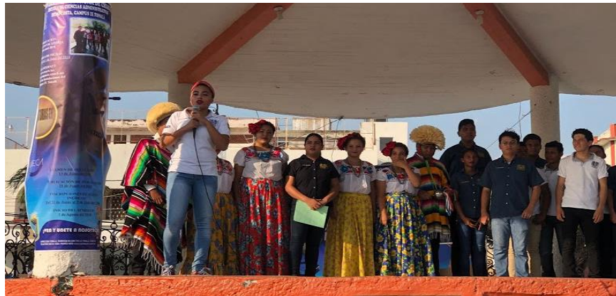
Ilustración 8. Encargados de la realización del evento

El evento fue organizado, amenizado y bajo la conducción de los mismos alumnos participantes del proyecto de UVD en coordinación con sus compañeros miembros de la sociedad de alumnos de la escuela. Los premios fueron gestionados por ellos mismos, al igual que el lugar y los instrumentos necesarios para que este evento se llevara a cabo.