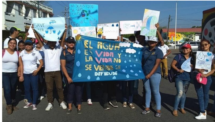
Ilustración 3. Marcha por el día Mundial del Agua

Así mismo el equipo de sustentabilidad realizó un Concurso de Reciclaje de Botellas PET en el que se premió a los tres primeros lugares con montos de $500, $300 y $200 respectivamente. Este concurso tenía como finalidad hacer conciencia entre los alumnos de nivel medio superior sobre la importancia del reciclaje y así mismo recolectar taparrosas para apoyar a Fundación Rivera A.C., fundación que tiene una campaña permanente de recolección de taparrosas para poder ayudar a niños con cáncer que necesiten quimioterapia.