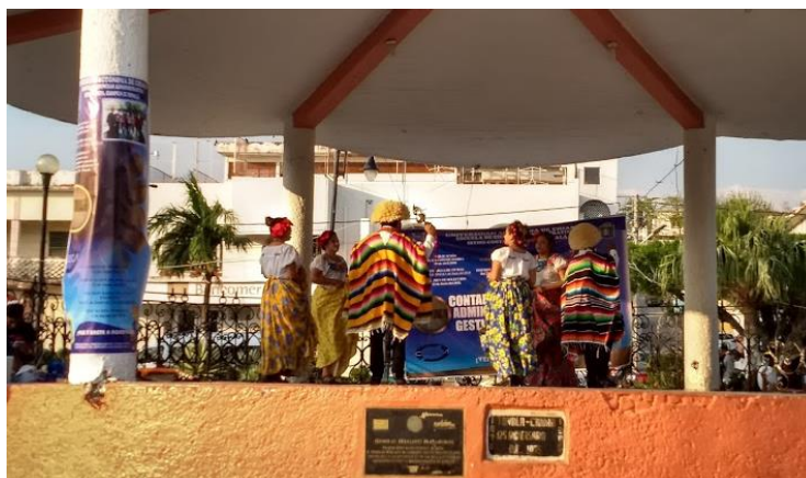
Ilustración 5. Presentación de Baile Folklórico

Finalmente el equipo de rescate cultural se dio a la tarea de montar bailables folklóricos y de involucrar a los alumnos del campus en los distintos cuadros, ya que no existía un programa de baile folklórico vigente en la escuela. Los integrantes del equipo grababan los bailables acompañados de una cápsula informativa sobre el origen del baile, el significado de los elementos del vestuario y la música de este. El equipo logró montar 8 cuadros de baile y para la emisión final sorprendieron al público con un baile sorpresa, que era la adaptación moderna de uno de los bailes.