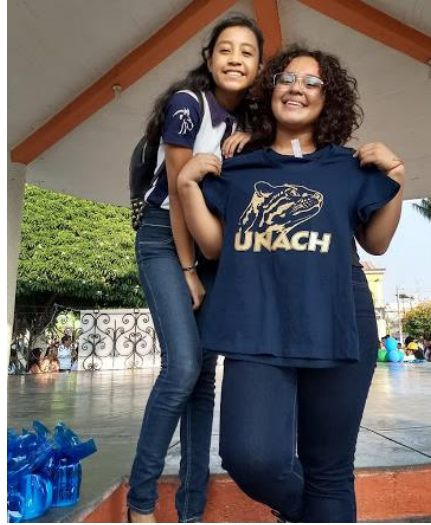
Ilustración7. Premios representativos de la universidad

El evento fue organizado, amenizado y bajo la conducción de los mismos alumnos participantes del proyecto de UVD en coordinación con sus compañeros miembros de la sociedad de alumnos de la escuela. Los premios fueron gestionados por ellos mismos, al igual que el lugar y los instrumentos necesarios para que este evento se llevara a cabo.