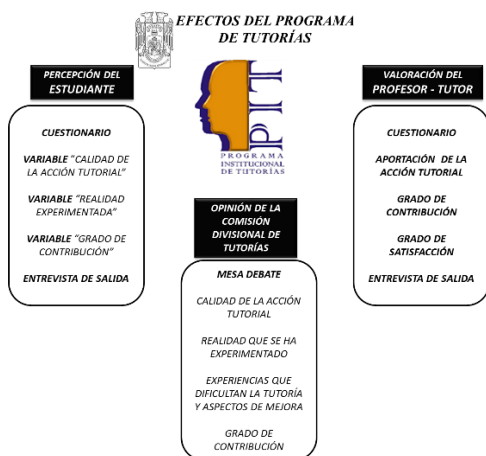
Figura 1. Estratos de la población objeto de estudio

Sobre esta base, el enfoque metodológico a seguir en esta investigación fue mixto (Cuantitativo-Cualitativo), dada la naturaleza del problema de estudio; a través de él se observaron tres sujetos distintos que comparten un mismo contexto institucional: el tutor, el tutorado y los responsables de la comisión de tutorías.