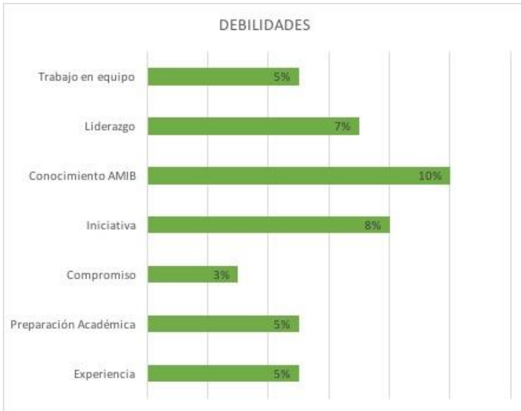
Gráfica 2. Debilidades observadas en los LAF