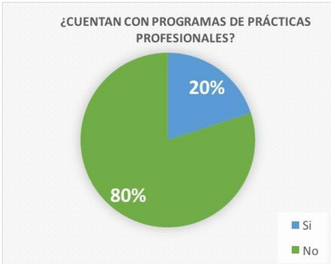
Gráfica 6. ¿Cuentan con programas de prácticas profesionales?