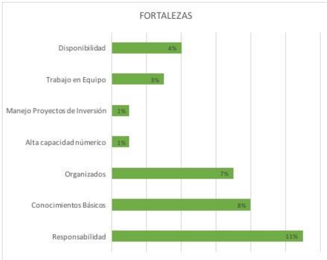
Gráfica 3. Fortalezas observadas en los LAF