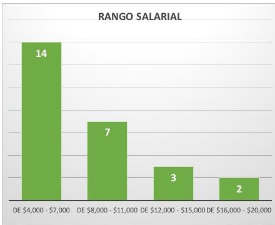
Gráfica 5. Salarios actuales que se le paga a un LAF