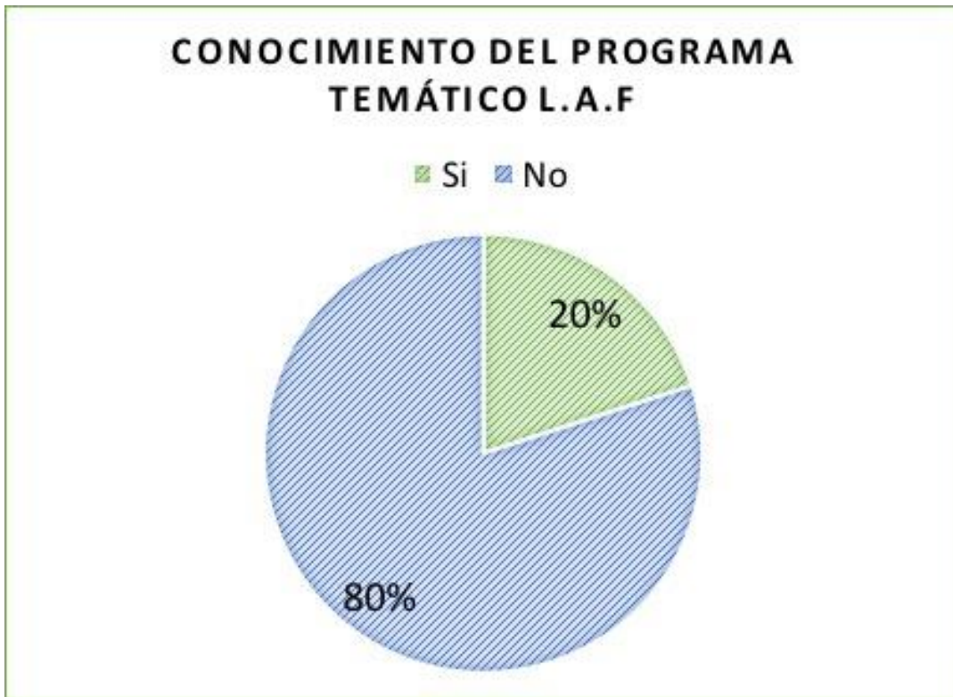
Gráfica 4. Conocimientos del plan temático LAF